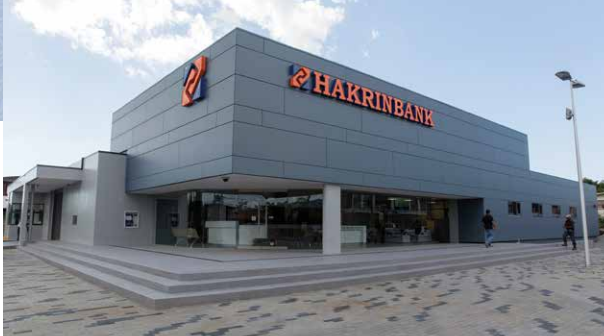
Het nieuwe filiaal van de Hakrinbank aan de Anamoestraat te Tourtonne.

In samenwerking met een commerciële partner is onze dochteronderneming, Hakrinbank Real Estate N.V., die zich richt op het kopen, verkopen en/of exploiteren van onroerende goederen, gestart met de uitvoering van een onroerend goed project in het district Commewijne. Momenteel wordt de laatste hand gelegd aan het business- en marketingplan. In het eerste halfjaar 2015 werd een klein aanloopverlies gerealiseerd.